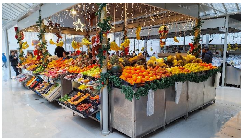
Mercado Bolhão – aqui pode passar algum tempo a apreciar e a degustar

Produtos de cortiça Bacalhau Queijos/Presunto Cerâmicas Conservas de Peixe Vinho